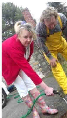
Problém s kanalizací v Domě pečovatelské služby...